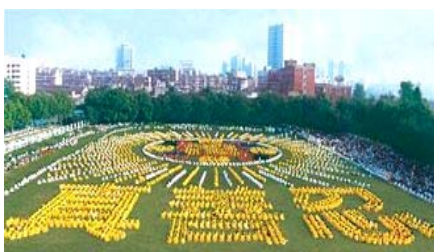
■一九九八年，武汉，五千多名法轮功学员集体炼功。