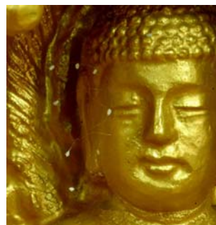
的南 优昙婆罗花 韩寺院发现