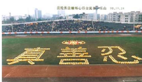
■一九九八年十月四川乐山法会期间大型排字

二姐想办法托人秘密地给我借了几本书，还有磁带，在电话里，一遍又一遍地告诉我怎么炼，怎么修，又念师父最近几年的讲法给我听。我心灵像是打开了一扇明亮的窗户。对一切都有了新的认识。我相见恨晚、悔恨莫及。（转下页）