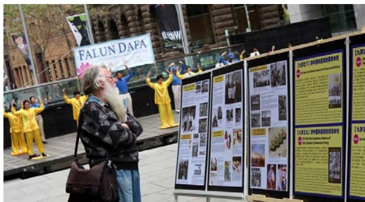
杰克对中共迫害这样祥和的团体感到不可理解