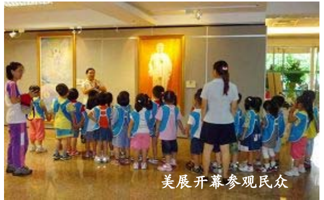
美展开幕参观民众

“真善忍国际美展”于二零零九年九月四日至十三日在台北县三重市社教馆展出，有十二所学校，包括高中、国小、幼稚园等一千一百多名师生集体报名，取得预约参观场次。许多观众表示，看到宣传单上《纯真的呼唤》画作中女孩坚毅动人的眼神，象在诉说及渴求人们关注目前正在发生的故事，因而深受吸引前来观赏。