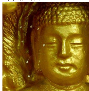
韩国全罗南道顺天市海龙面的须弥山禅院的佛像上长出

“优昙婆罗花”是传说中的仙界极品之花，因其花“青白无俗艳”被尊为佛家花。婆罗奇花花茎细如发丝、蚕丝，色如玉，白如雪，花形如钟，周围散着淡淡的光晕，有的散发出淡淡清香。用放大镜细看：花瓣微张、有光晕；花茎纤细、有韧劲；无叶相衬，无枝相绕，均现一根、一茎、一花之玉体。优昙婆罗花分布天然均匀，或开或闭，茎有直有曲，花、茎多不相交，疏朗有致，浑然天成。