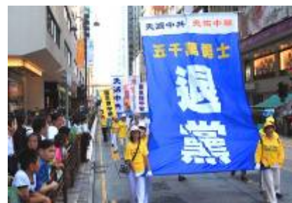
香港的退党大游行