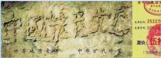
■ 2002年在贵州平塘县掌布乡发现

古今中外有许多预言，都惊人一致地预言中共要灭亡，还记载着天灭中共时其追随者被一同诛灭的可怕惨景。贵州平塘县的“藏字石”就是在告诉人们“天灭中共”的天象。