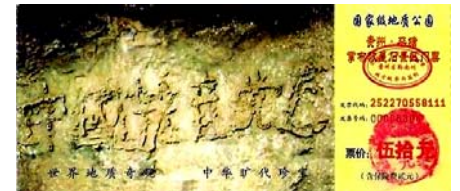
上图为贵州平塘县掌布乡“藏字石”风景区门票

中共的恶行，老天都在看着呢！为什么现在很多人都在争着看法轮功真相传单、《九评共产党》，并退出党团队呢？因为加入它就是它的一份子，天灭它时就要跟着遭殃。所以退党可不是什么参与政治，是在顺天意保命啊！在贵州省平塘县掌布乡风景区内，有一块二点七亿年的有字石头——“藏字石”。零二年六月当地人发现，裂开的石头断面有一行汉字，这些汉字经三批国内专家鉴定，其结论为天然形成。而石头上清晰可见的六个字是：中国共产党亡。难道石头也搞政治吗？这不分明是上天警示人吗？