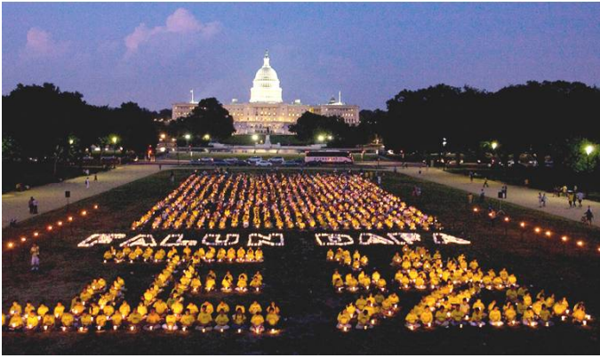
二零零九年七月十六日晚，美国国会山前法轮功学员烛光集会，悼念十年来被中共迫害致死的大陆同修，并组字“正法”和英文“法轮大法”。

【明慧网】二零零九年七月二十日，法轮功学员反迫害十周年之际，在亚、美、欧、澳各国的大集会和游行纷纷举行，呼吁更多人关注对法轮功的迫害，认清中共的邪恶，共同制止迫害。