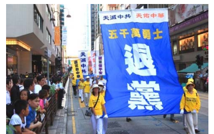
香港声援“三退”大游行