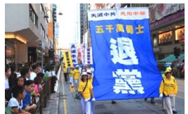
香港声援“三退”大游行 29

这个消息在戒毒所内引起了强烈的震动。听到这个消息的人，都有被中共欺骗的感觉，心里滋味难以言表。一个警察气愤地说：“江泽民真坏！叫警察迫害法轮功，叫我们犯罪。”她还说：“一开始，还以为中央镇压法轮功是对的，可后