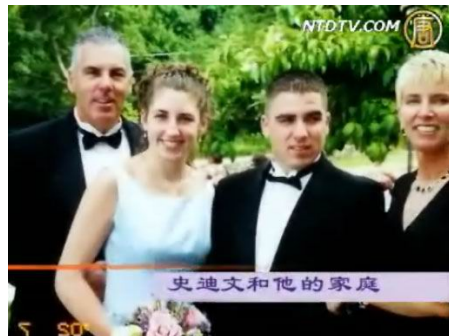
史迪文和他的家庭