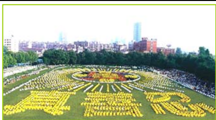
1997年武汉五千多法轮功学员炼功，排组法轮图形和“真善忍”字样

炼大法，以“真善忍”为根本指导。经亿万人的修炼实践证明，法轮大法是大法大道，在把真正修炼的人带到高层次的同时，对稳定社会、提高人们的身体素质和道德水准，也起到了不可估量的正面作用。