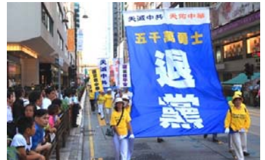
香港声援“三退”大游行 29

这个消息在戒毒所内引起了强烈的震动。听到这个消息的人，都有被中共欺骗的感觉，心里滋味难以言表。一个警察气愤地说：“江泽民真坏！叫警察迫害法轮功，叫我们犯罪。”她还说：“一开始，还以为中央镇压法轮功是对的，可后