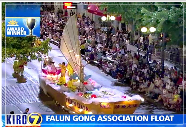
2009年7月25日美国电视7台直播了海洋节游行盛况。银屏上，金色“大法船”在云雾间穿行。观众持续鼓掌。