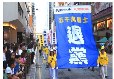
香港声援“三退”大游行

辽宁省某戒毒所所长，前段时间到香港考察，看到了一个令他震惊的事实：在香港，法轮功学员传《九评共产党》、发法轮功真相传单、劝市民三退（退党团队）、炼功、游行等等，一切活动都是公开的、受当地法律保护的。这位所长回来后讲给同事听，他感慨地说：“原来全世界只有中共在镇压法轮功啊！”