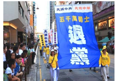
香港声援“三退”大游行

辽宁省某戒毒所所长，前段时间到香港考察，看到了一个令他震惊的事实：在香港，法轮功学员传《九评共产党》、发法轮功真相传单、劝市民三退（退党团队）、炼功、游行等等，一切活动都是公开的、受当地法律保护的。这位所长回来后讲给同事听，他感慨地说：“原来全世界只有中共在镇压法轮功啊！”