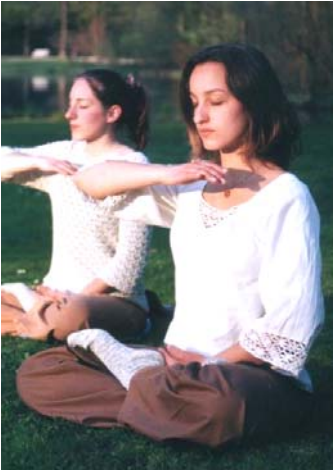
图：一对德国姐妹在炼功

法轮功也称法轮大法，是佛家上乘修炼大法，以“真善忍”为根本指导。经亿万人的修炼实践证明，法轮大法是大法大道，在把真正修炼的人带到高层次的同时，对稳定社会、提高人们的身体素质和道德水准，也起到了不可估量的正面作用。