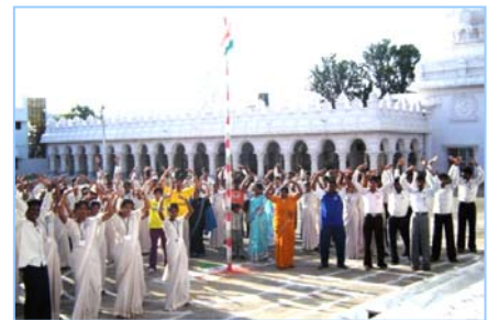
■在印度班加罗尔炼功(2009.5)