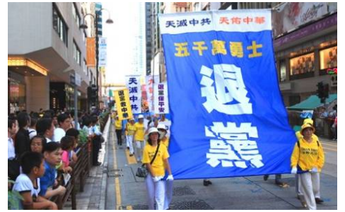
香港声援“三退”大游行

辽宁省某戒毒所所长，前段时间到香港考察，看到了一个令他震惊的事实：在香港，法轮功学员传《九评共产党》、发法轮功真相传单、劝市民三退（退党团队）、炼功、游行等等，一切活动都是公开的、受当地法律保护的。这位所长回来后讲给同事听，他感慨地说：“原来（全世界）只有中共在镇压法轮功啊！”