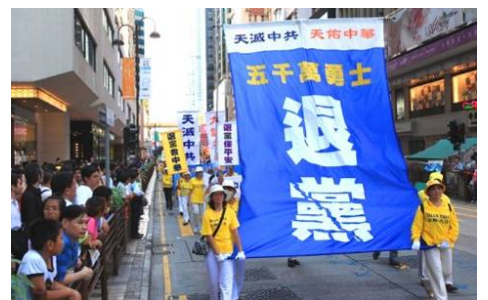
香港声援“三退”大游行

辽宁省某戒毒所所长，前段时间到香港考察，看到了一个令他震惊的事实：在香港，法轮功学员传《九评共产党》、发法轮功真相传单、劝市民三退（退党团队）、炼功、游行等等，一切活动都是公开的、受当地法律保护的。这位所长回来后讲给同事听，他感慨地说：“原来（全世界）只有中共在镇压法轮功啊！”