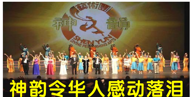
【明慧网】神韵纽约艺术团在美国首都华盛

演出取消了，可佛法能被取消吗？那偶尔露真容、示天机的法轮能被取消吗？被中共邪党迫害了十年的法轮功不是依旧在民间传播着吗？一九九二年在中国传出的法轮功目前在世界上已经洪传了一百一十四个国家和地区了啊！《转法轮》也被译成三十八种文字在世界广为流传了啊！有缘的中国人啊，您什么时候才能与法轮功结上缘呢？