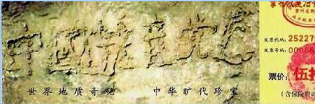
■2002 年在贵州平塘县掌布乡发现的藏字石，石头断面上天然形成六个字：中国共产党亡，昭示着“天灭中共”的天意。图为风景区门票。

大伙呼拉一下过来围著名单，争着挑选自己中意的名儿。连阴先生也要了个名儿。一年轻人悄声对王老太太说：“那个叫‘神了，神了’的人，就是我们那的公安厅长。”