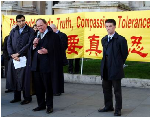
欧洲议会副主席斯考特先生在记者会上发言

【明慧网】十二月十日，国际人权日，法轮功学员在英国伦敦市中心鸽子广场的北面平台举行集会和游行活动，呼吁民众关注正在中国发生的人权迫害，包括中共活摘法轮功学员人体器官的罪恶行径，呼吁民众伸出援手共同制止中共对法轮功的迫害。欧洲议会副主席斯考特先生在发言中说，他对西班牙最高法院起诉江泽民等五人的决定非常欢迎。他想要警告在中国施行迫害或酷刑行径的那些人，在当今社会，酷刑罪是没有豁免权的。