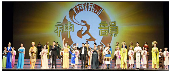
■二零零九年十二月十九日晚，神韵演员在奥古斯塔第二场演出后谢幕。

(明慧记者苏青综合报导)二零零九年十二月十九日，美国神韵纽约艺术团在美国乔治亚州奥古斯塔市 (Augusta) 的贝尔会堂 (The Bell Auditorium) 拉开了二零一零年全球巡演的序幕。下午和晚上的两场精彩演出，节目全新、立意高妙、技巧超卓、舞台造型靓丽，内容高潮迭起，牵动全场观众陶醉其中。