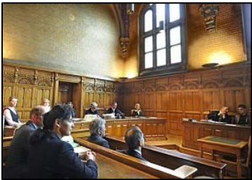
西班牙国家法院

2007 年 10 月 15 日，十五位法轮功学员向西班牙法庭递交诉状，指控江泽民等人十年来对法轮功学员实行洗脑、劳教、精神药物摧残、酷刑、活摘器官等犯罪行为。经过两年取证调查后，西班牙国家法庭法官 Ismael Moreno 依照国际法“普世司法管辖权原则”（Universal Jurisdiction）裁决，对江泽民等签发了传讯令。