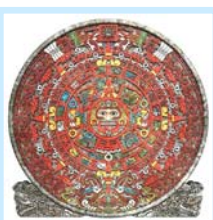
玛雅金字塔和 玛雅人的历法盘