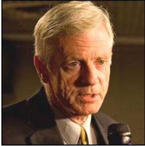
加拿大前亚太司司长大卫·乔高

个主要国家的独立法庭能够做出这样的决定，是一个意义非凡的进展。” “西班牙法官说，如果在一定时间内，法庭没有得到回应，法庭就会向五名高官发出通缉令——中国前国家主席面临起诉，这真是一个巨大的进展！” “我知道全世界的媒体都在报道这件事，所以它真的是非凡的一步。我知道，阿根廷的法院也正在考虑这个案件，他们还没有做出最后的决定，但已经是一个巨大的进步了。”