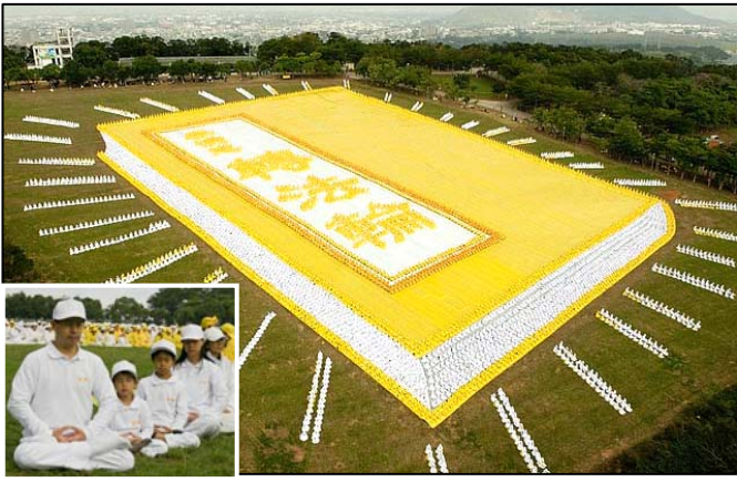
■ 2009 年 11 月 21 日，来自亚太国家的约 6000 多名法轮功学员在台湾台中县外埔乡集体炼功（小图），排组出巨幅《转法轮》书籍图形。