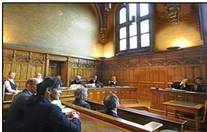
西班牙国家法院