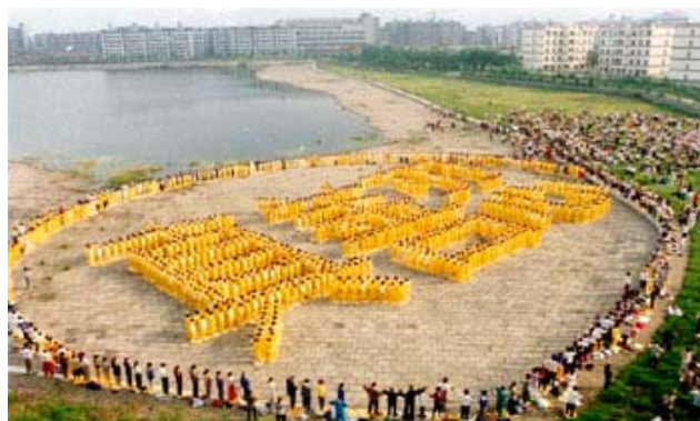
九八年武汉法轮功学员集体炼功排字