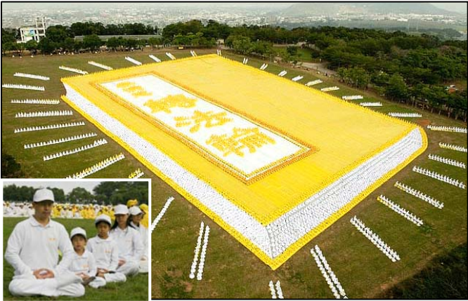
2009 年 11 月 21 日，来自亚太国家的约 6000 多名法轮功学员在台湾台中县外埔乡集体炼功（小图），排组出巨幅《转法轮》书籍图形。

泰国著名爱国华侨泰亿利有限公司总经理钟奕江先生，原患有视网膜黄斑病变，是中西医都棘手的不治之症，李老曾破例为其调治，让他闭眼后，几分钟内高功能治疗，一次彻底治愈，没收分文报酬。一九九九年十月一日中国北京国庆大典