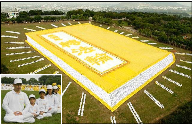
2009 年 11 月 21 日，来自亚太国家的约 6000 多名法轮功学员在台湾台中县外埔乡集体炼功（小图），排组出巨幅《转法轮》书籍图形。

泰国著名爱国华侨泰亿利有限公司总经理钟奕江先生，原患有视网膜黄斑病变，是中西医都棘手的不治之症，李老曾破例为其调治，让他闭眼后，几分钟内高功能治疗，一次彻底治愈，没收分文报酬。一九九九年十月一日中国北京国庆大典