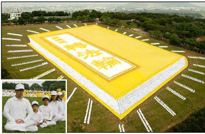
■ 2009 年 11 月 21 日，来自亚太国家的约 6000 多名法轮功学员在台湾台中县外埔乡集体炼功（小图），排组出巨幅《转法轮》书籍图形。