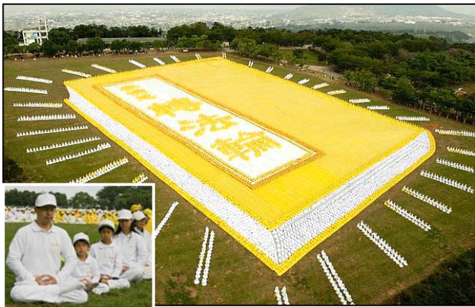
■ 2009 年 11 月 21 日，来自亚太国家的约 6000 多名法轮功学员在台湾台中县外埔乡集体炼功（小图），排组出巨幅《转法轮》书籍图形。