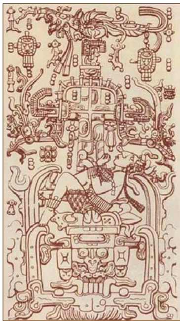
“白神之神”库库玛兹弓着身，似乎正在驾驭一个尖头长躯体的飞行怪兽。

在高度的文明发展后，绝大部分所谓“聪明”的古玛雅人，也因为生活渐渐地堕落，走向道德沦丧的境地。而历史证明，他们最终面对的正是“聪明”而不顾道德所带来的毁灭；而善良单纯的玛雅人被保留下来了。