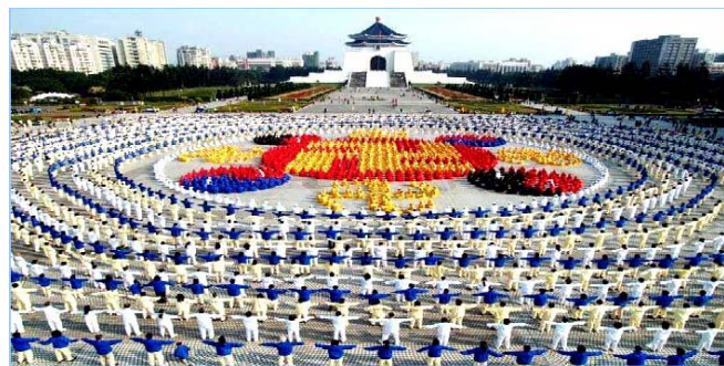
■ 2005年12月25日，台湾4000多名法轮功学员集体炼功，排组法轮图形。

法轮功迄今已弘传世界114个国家和地区，受到世界人民的爱戴和尊敬。因李洪志先生和法轮大法对人类身心健康作出的杰出贡献，已获得各国政府褒奖、支持议案信函超过3000项。法轮功书籍被译成30多种语言。自2000年起，李先生连续四年被提名诺贝尔和平奖。◇