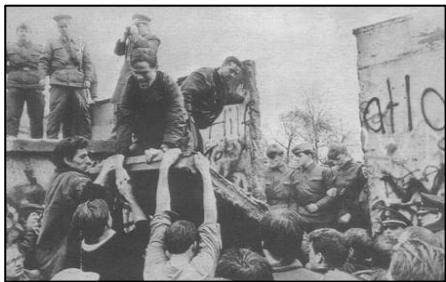
1989 年 11 月柏林墙被拆除的瞬间

故事发生在柏林墙倒塌之后的德国。一九九二年二月，统一后的柏林法庭上，举世瞩目的柏林围墙守卫案将要开庭宣判。这次接受审判的是四个年轻人，都三十岁不到，他们曾经是柏林墙的东德守卫。