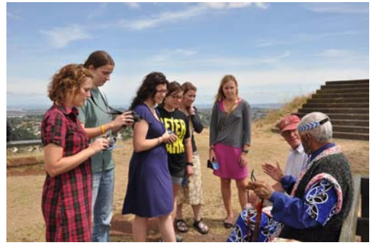
■游客们人手一份法轮功传单与酋长交谈

客。人们一到山顶，就被酋长特有的服饰所吸引，当得知酋长上山为了声援法轮大法，更是充满了兴趣，几乎每个人都拿了一份法轮大法真相传单。很多人和酋长愉快交谈并合影留念；中国大陆的游客们纷纷把报纸和光碟藏进书包，其中三人当即退党。◇