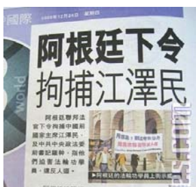
12月24日香港《都市日报》的有关报道

12月17日，阿根廷法庭以群体灭绝罪和酷刑罪两项罪名，对迫害法轮功的元凶江泽民和罗干发出国际通缉令，要求国际刑警组织对这两名罪犯实施逮捕。之后该消息被路透社、《华