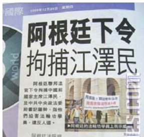
12月24日香港《都市日报》的有关报道

12月17日，阿根廷法庭以群体灭绝罪和酷刑罪两项罪名，对迫害法轮功的元凶江泽民和罗干发出国际通缉令，要求国际刑警组织对这两名罪犯实施逮捕。之后该消息被路透社、《华