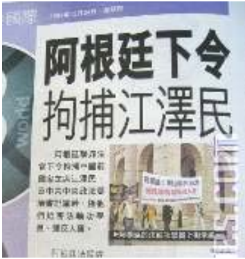
■12月24日香港《都市日报》的有关报道

12月17日，阿根廷法庭以群体灭绝罪和酷刑罪两项罪名，对迫害法轮功的元凶江泽民和罗干发出国际通缉令，要求国际刑警组织对这两名罪犯实施逮捕。之后该消息被路透社、《华盛顿邮报》、《纽约时报》等世界多家媒体广泛报道。