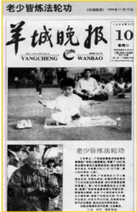
■ 1998年11月10日《羊城晚报》：老少皆炼法轮功

1999年中共镇压前，在中国大陆已有一亿人在修炼法轮功，当时的大陆媒体，对法轮功祛病健身的奇效和教人向善的良好道德风范，做过多次的报道。1997年3月17日，《大连日报》刊登通讯