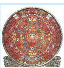
玛雅金字塔和 玛雅人的历法盘