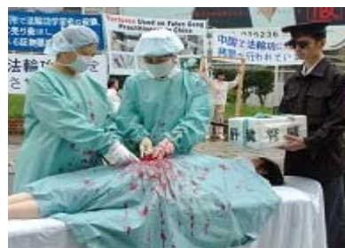
■ 图为日本法轮功学员曝光中共活摘器官罪行。

根据中国医疗器官移植协会的数据，中国在 1994—1999 年，大约进行了 18500 个器官移植。而在 2000—2005 年，移植数量猛增到 60000 个，这个阶段也正是法轮功学员被迫害最残酷的时期。