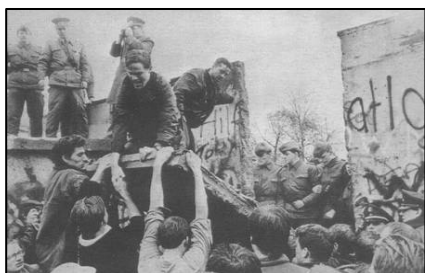
1989 年 11 月柏林墙被拆除的瞬间

故事发生在柏林墙倒塌之后的德国。一九九二年二月，统一后的柏林法庭上，举世瞩目的柏林围墙守卫案将要开庭宣判。这次接受审判的是四个年轻人，都三十岁不到，他们曾经是柏