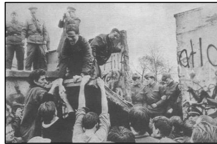
1989 年 11 月柏林墙被拆除的瞬间