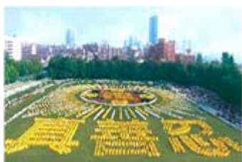
■1998 年武汉 5000 多名法轮功学员排字集体炼功。