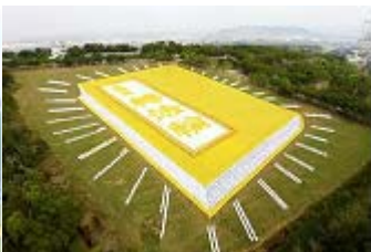
■2009 年 11 月 21 日 6 千多名亚太地区法轮功学员举办大型排字活动。

法轮功已弘传世界 114 个国家，受到世界人民的爱戴和尊敬。因李洪志先生和法轮大法对人类身