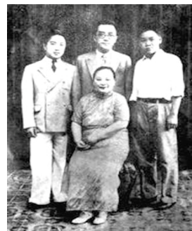
中：胡适；左：长子胡思杜；右：次子胡思杜。