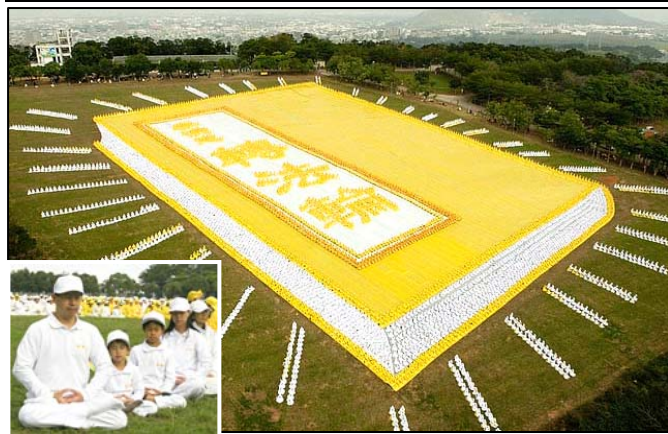
■ 2009年11月21日，来自亚太国家的约6000多名法轮功学员在台湾台中县外埔乡集体炼功（小图），排组出巨幅《转法轮》书籍图形。