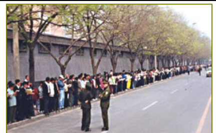
法轮功学员文明安静，警察不用维持秩序，在一旁聊天。学员背后不是中南海红墙，所谓的“围攻中南海”根本不存在。