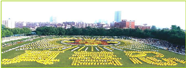
1998 年武汉 5000 多名法轮功学员炼功，排组法轮图形和“真善忍”字样。