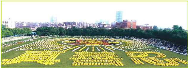
1998 年武汉 5000 多名法轮功学员炼功，排组法轮图形和“真善忍”字样。