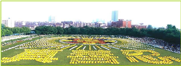
1998 年武汉 5000 多名法轮功学员炼功，排组法轮图形和“真善忍”字样。