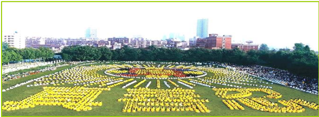
1998 年武汉 5000 多名法轮功学员炼功，排组法轮图形和“真善忍”字样。