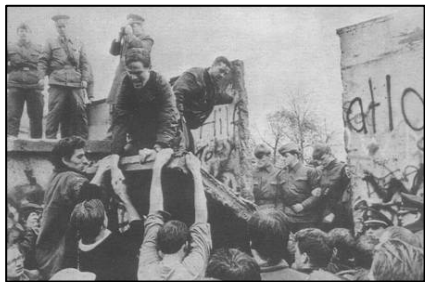
1989 年 11 月柏林墙被拆除的瞬间