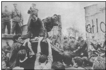
1989 年 11 月柏林墙被拆除的瞬间