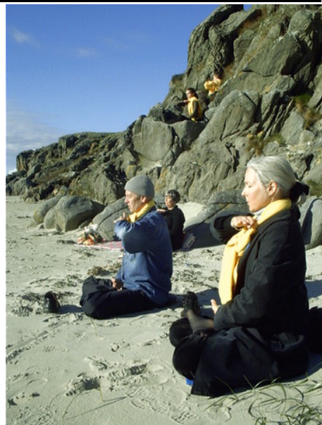
挪威法轮功学员在海滨炼功

是给我带来的精神上的充实，戒掉了赌博，更重要的是：教会了我做人的道理，我知道了为什么活着。