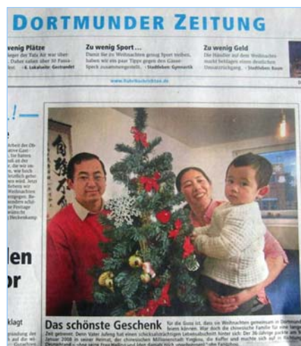
德国《鲁尔信息报》地方版头版

也是与众不同的：‘我修炼法轮功，因此成为中共的眼中钉。’中共对修炼这个功法的学员进行毫不留情的迫害，抓捕，酷刑甚至屠杀。”