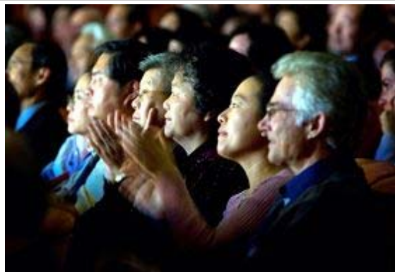
神韵纽约艺术团在旧金山著名的歌剧院上演了第六场演出,各族裔陶醉。

蹈家,她从四岁开始跳舞,目前带领舞蹈团体已有十二年。保罗女士认为神韵晚会的节目很精彩,其中的舞剧非常美妙与神奇,故事曲折而引人入胜;舞蹈演员的服装做工精细,色彩绚丽,装饰优雅美丽。