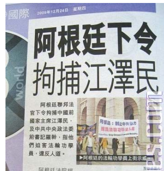
■ 2009年12月24日香港《都市日报》的有关报道