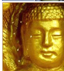
上图：纽约上州，苹果上的优昙婆罗花。