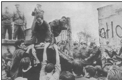
1989 年 11 月柏林墙被拆除的瞬间

故事发生在柏林墙倒塌之后的德国。一九九二年二月，统一后的柏林法庭上，举世瞩目的柏林围墙守卫案将要开庭宣判。这次接受审判的是四个年轻人，都三十岁不到，他们曾经是柏林墙的东德守卫。