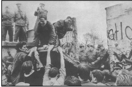
1989 年 11 月柏林墙被拆除的瞬间

故事发生在柏林墙倒塌之后的德国。一九九二年二月，统一后的柏林法庭上，举世瞩目的柏林围墙守卫案将要开庭宣判。这次接受审判的是四个年轻人，都三十岁不到，他们曾经是柏林墙的东德守卫。