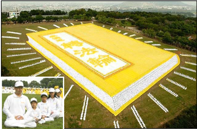
2009 年 11 月 21 日，来自亚太国家的约 6000 多名法轮功学员在台湾台中县外埔乡集体炼功（小图），排组出巨幅《转法轮》书籍图形。

2009 年 11 月，西班牙国家法庭做出了一项史无前例的裁定，决定以“群体灭绝罪”及“酷刑罪”，起诉江泽民、罗干、薄熙来、贾庆林、吴官正五名