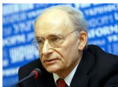
加拿大著名人权律师大卫·麦塔斯