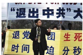
大华府及纽约著名人权律师叶宁