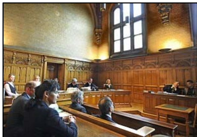
西班牙国家法院