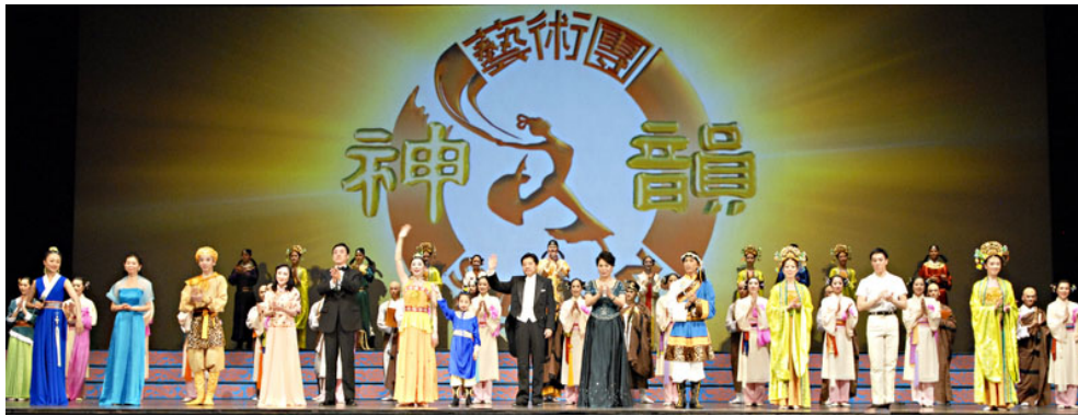
■ 二零零九年十二月十九日晚，神韵演员在奥古斯塔第二场演出后谢幕。