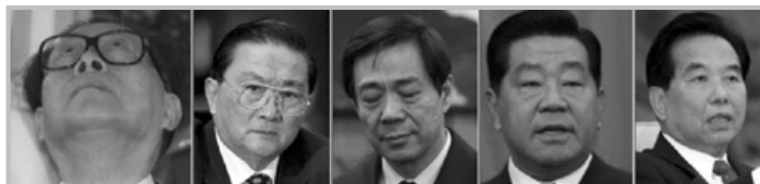
江泽民 罗干 薄熙来 贾庆林 吴官正

其实，按照人性、道德这些超越任何政治、经济等世俗的理念，江泽民、罗干这些中共头目迫害法轮功，其非法的本质毫无疑问，对人类的危害也毫无疑问。在迫害事实越来越真相大白、在法轮功学员坚守的“真、善、忍”对人类未来的重要性越来越为人们认知的时候，必然会有更多的人坚定的站出来，以各种各样的方式支持法轮功学员、维护“真、善、忍”信仰，迫害者也会在世界各地被诉诸法律。◇